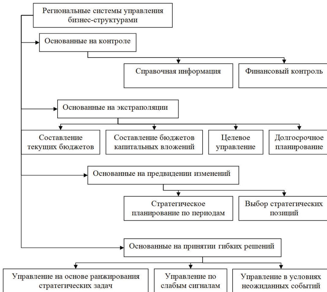
Рис. 2. Классификация региональных систем управления бизнес-структурами на основе эволюционного подхода