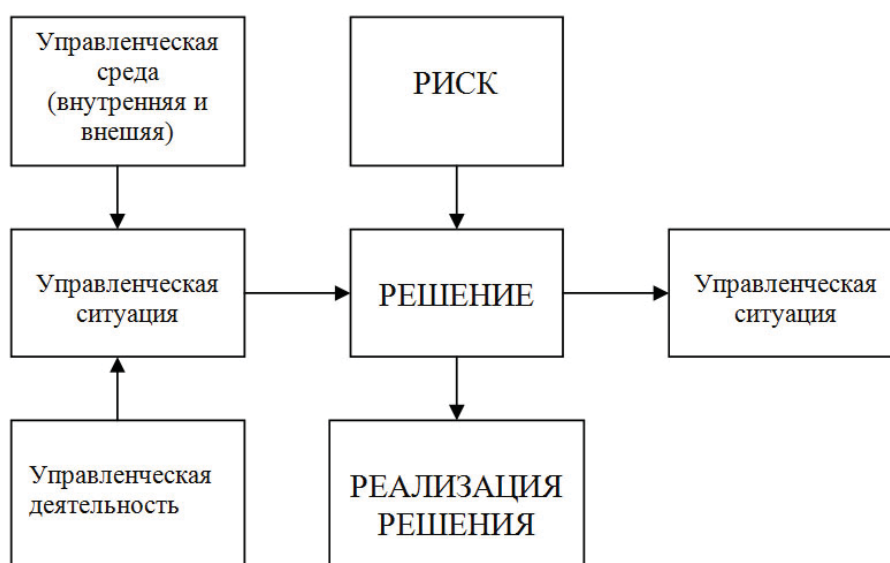
Рис. 2. Реализация функции управления через этап принятия решения

На рис. 2 представлена схема реализации вида деятельности через управленческое решение.