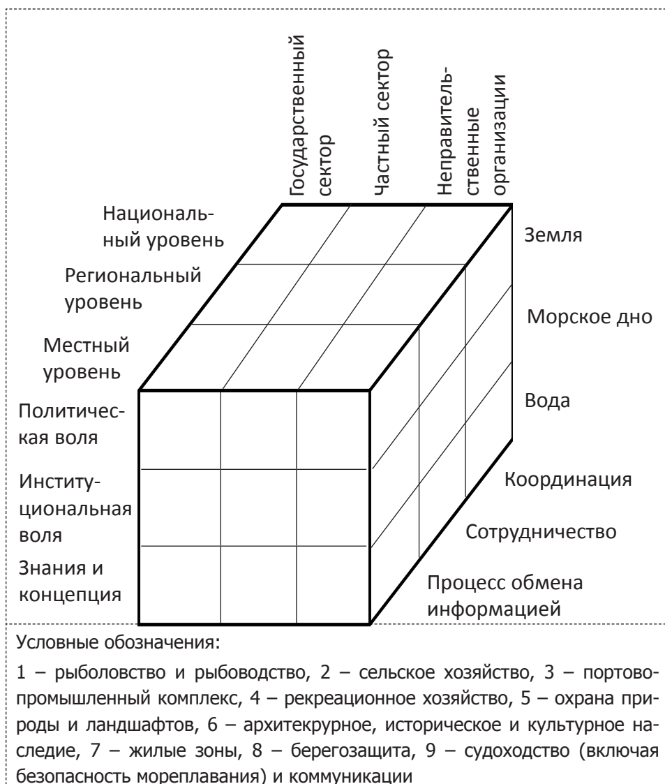
Рис. 1. Схематичная модель КУПЗ