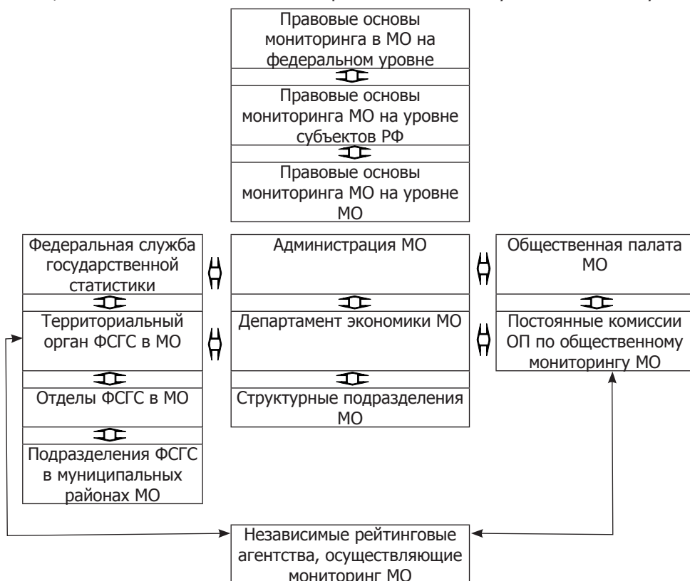
Рис. 2. Предлагаемая организационно-правовая система социально-экономического и кадрового мониторинга в муниципальном образовании

В соответствии с вышеизложенным мы предлагаем внести изменения в ст. 19 ФЗ «Об основах общественного контроля в Российской Федерации», исключить указание на «временное наблюдение» за деятельностью органов местного самоуправления, таким образом, сделав его систематическим. Также это позволит организовать в рамках общественных палат муниципальных образований постоянно действующие комиссии по мониторингу, главным образом, качественных показателей кадровой политики в муниципальной службе.