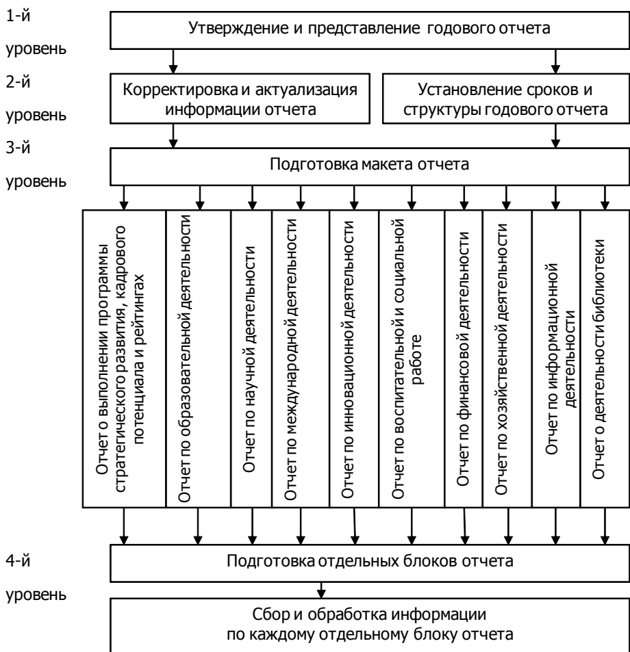
Рис. 3. Модель бизнес-процесса формирования и представления годового отчета ВГУ

В свою очередь ректор как инициатор и главный координатор процесса подготовки формирования и представления публичной отчетности вуза вносит корректировки и актуализирует отражаемую в отчетности информацию, исходя из парадигмы развития университета как образовательного центра в соответствии с проводимой политикой государства в сфере образования и науки. Дает оценку основным достижениям, определяет факторы и задачи на следующий отчетный период. В конечном итоге он утверждает итоговый вариант годового публичного отчета о деятельности вуза, который впоследствии проверяется аудиторской организацией и направляется на одобрение учетного и попечительского совета. В федеральных, национально-исследовательских университетах и вузах, включенных в программу «5/100», годовой отчет должен утверждаться Наблюдательным Советом, а затем размещается на сайте в открытом доступе.