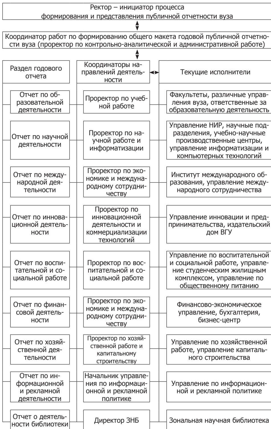
Рис. 1. Схема взаимодействия координаторов и исполнителей работ в процессе формирования публичной отчетности вуза

отчета по блоку «Образовательная деятельность» в разрезе видов выполняемых поручений, которые представлены в табл.1