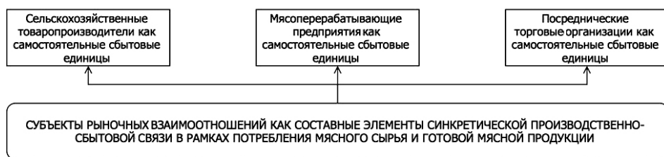
Рис. 3. Структурирование синкретической производственно-сбытовой цепочки рынка мясопродуктов в период кризисных явлений

Такое центробежное движение приводит к разрыву существующих между субъектами рынка кооперационных, производственно-сбытовых связей, что оказывает деструктивное воздействие дивергентного характера как на рынок в целом, так и на устойчивое развитие отдельных представителей этого рынка, в частности (рис. 4).