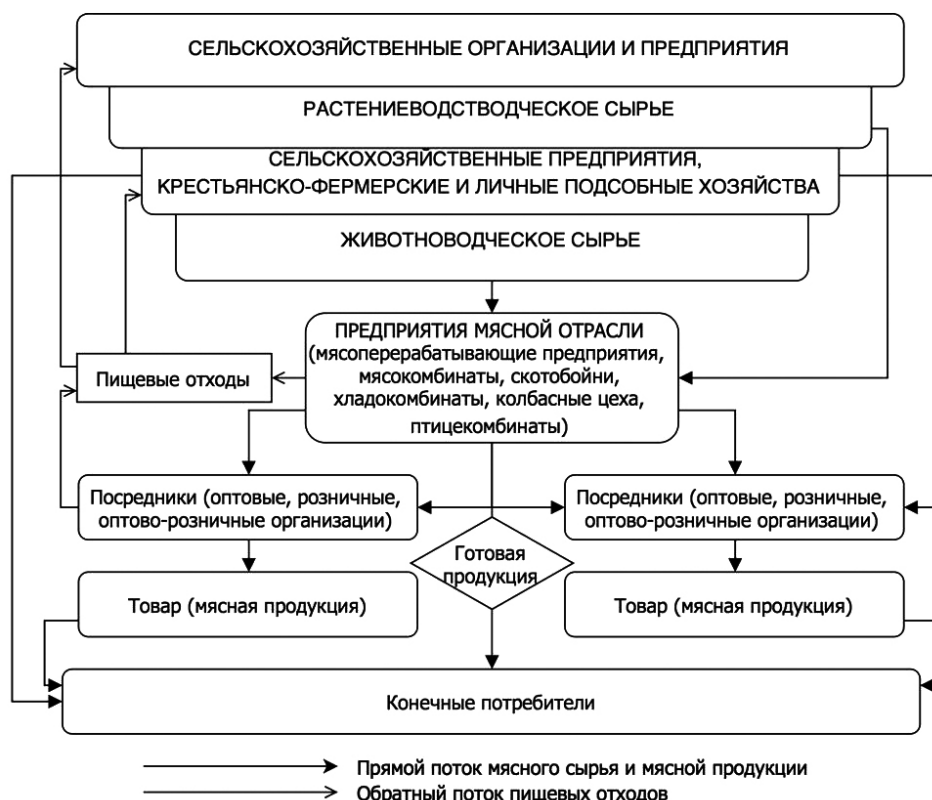
Рис. 2. Особенности товародвижения в условиях современного отраслевого рынка

Как следует из данных приведенного рисунка, особенностями движения мясного сырья и мясной продукции в рамках рынка мясопродуктов являются два аспекта. Прежде всего, необходимо отметить многоканальный характер распределения мясной продукции, которая достигает конечных потребителей посредством использования нескольких альтернативных товарных каналов сбыта и потребления.