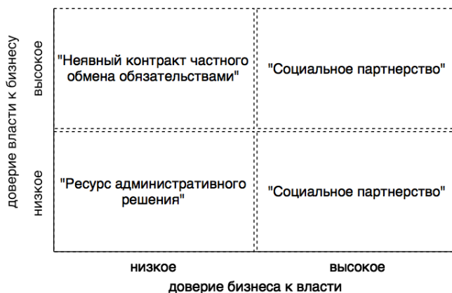
Рис. 2. Матрица взаимодействия властных и предпринимательских структур [6, с. 17]

По мнению Шабанова Р.Р., можно выделить четыре формы взаимодействия государства и частного сектора в зависимости от степени доверия экономических субъектов друг к другу и представить данные формы в виде матрицы взаимодействия (рис. 2).