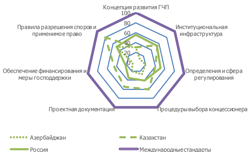
Рис. 3. Степень соответствия концессионного законодательства передовым международным стандартам

Закон о концессиях в России принят в 2005 г., однако для обеспечения стабильных, легитимных правил и норм необходим ещё комплекс отраслевых законов о концессиях, подзаконных актов, регламентирующих деятельность в рамках концессии, внесение изменений в налоговое законодательство, формирование институциональной среды, наличие системы государственного регулирования и контроля. Существующему российскому законодательству о концессиях, как наглядно демонстрирует рис. 3, еще предстоит долгий путь совершенствования [8, с. 41-42].