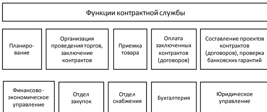
Рис. 1. Разграничений функций специалистов в сфере закупок по структурным подразделениям ФГБОУ ВО «ВГУ»

В соответствии с рис. 1 процесс закупки начинается с планирования и заведует этим сегментом финансово-экономическое подразделение. На основе анализа поданных заявок от подразделений университета составляется потребность в закупке тех или иных товаров для нужд университета [4]. В дальнейшем, исходя из бюджета организации, составляется план-график закупок. План-график поступает в отдел закупок, который позже вывешивается в единую информационную систему сотрудником отдела закупок. С этого момента начинается этап организации и подготовки процедур определения поставщика, что означает начало взаимодействия отдела закупок с непосредственными заказчиками, чьи заявки вошли в план-график.