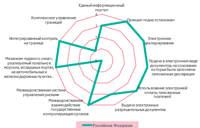
Рис. 2. Реализация отдельных элементов национального «единого окна» в Российской Федерации в 2016 г. 3

Использование принципа «единого окна» во взаимодействии участников ВЭД и государственных органов предоставляет ряд преимуществ: предсказуемость и прозрачность процесса «очистки» товаров, доступность информации об этом процессе, а также более низкий уровень случаев коррупционных проявлений за счет уменьшения количества актов взаимодействия с должностными лицами государственных органов [3].