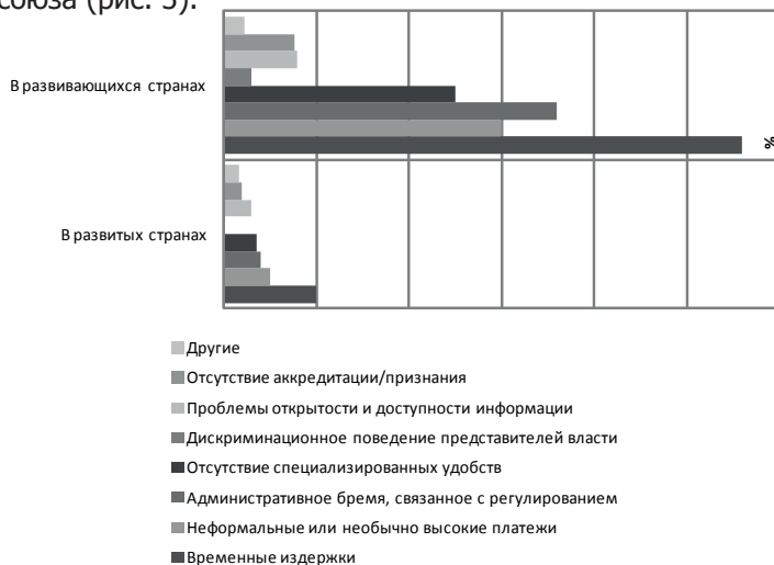
Рис. 3. Типы административных барьеров при прохождении процедур, связанных с экспортом товаров в развитые и развивающиеся страны 4 экспортерами ЕС в 2015-2016 гг., % [5]

Уровень возникающих при перемещении товаров через границу административных барьеров в развитых странах значительно ниже, чем в развивающихся. Такой вывод был получен по результатам опроса, проведенного специалистами Международного торгового центра среди экспортеров Европейского союза (рис. 3).