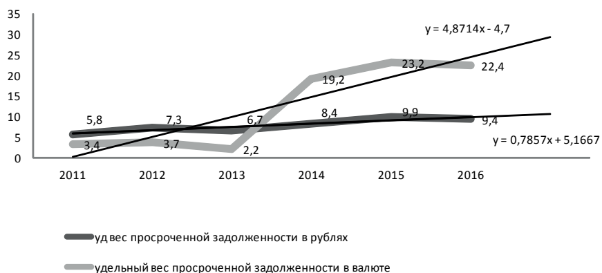
Рис. 3. Удельный вес просроченной задолженности в рублях и валюте, %

росту с незначительными колебаниями. В целом за исследуемый период она возросла в три раза и составила 9,4%. Удельный вес просроченной задолженности в валюте также по линейной зависимости имеет тенденцию роста и возросла она за 7 лет более чем в 4 раза, составив 22,4 % в 2016 г. (рис. 3).