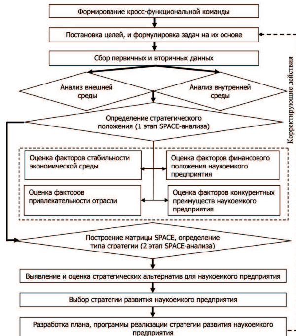
Рис. 1. Алгоритм выбора стратегии развития наукоемкого предприятия

Ключевые цели развития наукоемкого бизнеса могут быть связаны: с занятием конкретной доли на рынке, с увеличением объемов научно-исследовательской и опытно-конструкторской работы, с обеспечением продукции и услуг высокого качества и т.д. [10]. При постановке целей необходимо учитывать текущий уровень развития предприятия. Так, для предприятий на начальном этапе жизненного цикла в приоритете могут быть капитализация, сопровождающаяся ростом выручки либо стоимости основных фондов [11]. Для более высокого уровня развития предприятия, например, может выступать необходимость расширения географии присутствия на рынке. Также предприятие может поставить перед собой цели для решения задач социального или идеологического характера [8, 12]. Вне зависимости от того, какова цель, она должна соответствовать ряду критериев. А именно: ориентации на конкретный период времени, измеримости, согласованности с другими целями, ресурсами компании, контролируемости. Определившись с целями, наукоемкое предприятие может начать реализовывать следующие этапы процесса стратегического планирования: сбор первичной и вторичной информации.