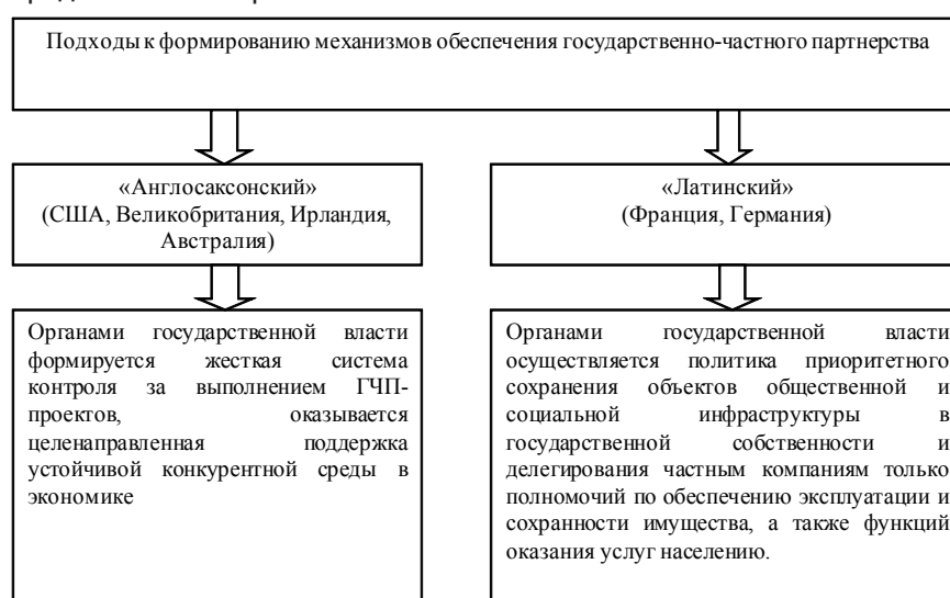
Рис. 2. Подходы к формированию механизмов обеспечения государственно-частного партнерства в зарубежных странах

Исходя из оценки мирового опыта, можно обозначить два основных подхода к формированию механизмов обеспечения ГЧП, которые схематично представлены на рис. 2.