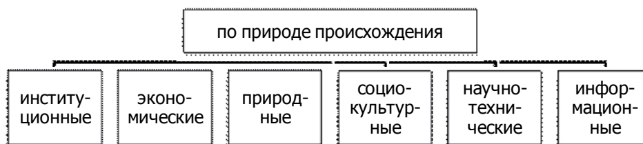
Рис. 3. Факторы, влияющие на управление изменениями в регионе

Дудов Д.А. рассмотрел практически все возможные факторы, которые могут повлиять на управление изменениями в регионе. Но мы считаем, что состав факторов, представленный автором, необходимо дополнить еще и кадровым фактором. Под кадровым фактором мы подразумеваем профессиональный уровень развития трудового потенциала населения региона и в особенности исполнительных органов государственной власти. Социально-экономическое развитие региона очень зависимо от правильных решений, которые в большей степени могут принимать именно качественно развитые кадры.