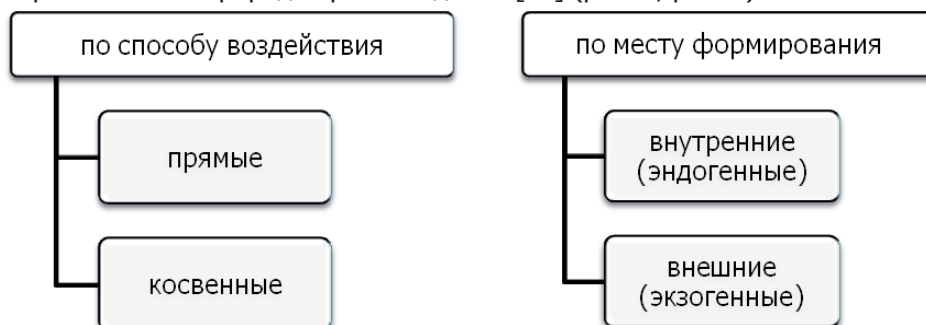
Рис. 2. Факторы, влияющие на управление изменениями в регионе

Несомненно, наиболее обширную классификацию факторов, влияющих на управление изменениями в регионе, сформулировал Дудов Д.А. Автор предлагает разделить факторы по способу воздействия, по месту формирования и по природе происхождения [10] (рис. 2, рис. 3).