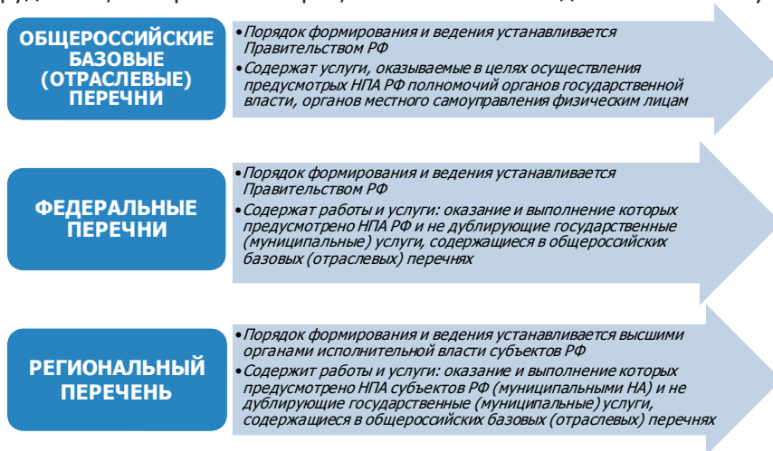
Рис. 1. Классификация элементов формирования госзадания

снования размера субсидий можно использовать нормативные траты, отражающие фактические материальные и трудовые затраты на исполнение госзадания. Нормативные траты включают в себя расходы на заработную плату сотрудникам, материалы и сырье, а также оказание дополнительных услуг.