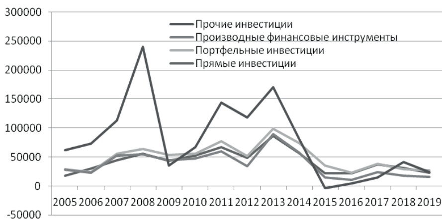
Рис. 3. Экспорт иностранных инвестиций в 2005-2019 гг., млн долл. США Составлено по материалам: [Банк России: URL: http://www.cbr.ru/statistics/ ]

Тенденции, представленные на рис. 3, описывают динамику экспорта капитала. Для данных трендов характерна меньшая вариация показателей. Разброс их значений описывается только положительными величинами, за исключением величины прочих инвестиций. Также к концу рассматриваемого периода практически по всем показателям достигаются начальные уровни.