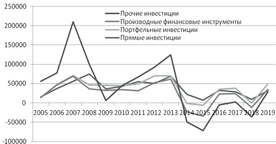
Рис. 2. Импорт иностранных инвестиций в 2005-2019 гг., млн долл. США Составлено по материалам: [Банк России: URL: http://www.cbr.ru/statistics/ ]