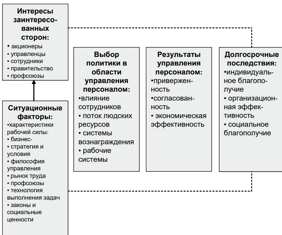
Рис. 2. Модель управления персоналом

Гарвардская модель оказала значительное влияние на теорию и практику управления человеческими ресурсами, особенно в том, что она акцентировала внимание на том, что управление человеческими ресурсами – это забота руководства в целом, а не функции управления персоналом в частности [1, 2, 12].