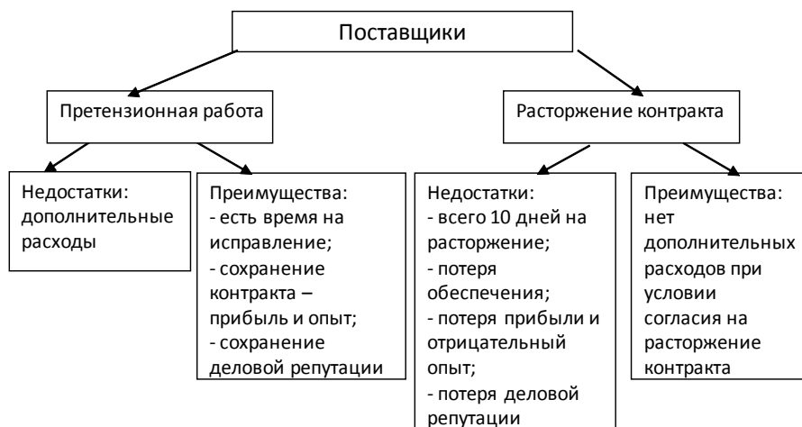
Рис. 2. Преимущества и недостатки претензионной работы и расторжения контракта для поставщика