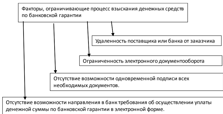
Рис. 3. Факторы, ограничивающие процесс взыскания денежных средств по банковской гарантии

В настоящее время важными являются сведения эффективной претензионной работы, так как все уплачиваемые поставщиками штрафы и пени являются доходами государства и перечисляются в государственный бюджет. Вместе с тем многие экономисты-аналитики отмечают, что претензионная работа осуществляется в режиме ограниченности трудовых ресурсов по причине высокой трудоемкости, так как заказчику необходимо каждое действие фиксировать по форме, позволяющей юридически доказать право заказчика взыскать денежные средства по банковской гарантии. Этот процесс в настоящее время является сложным. При этом существует ряд факторов, ограничивающих этот процесс.