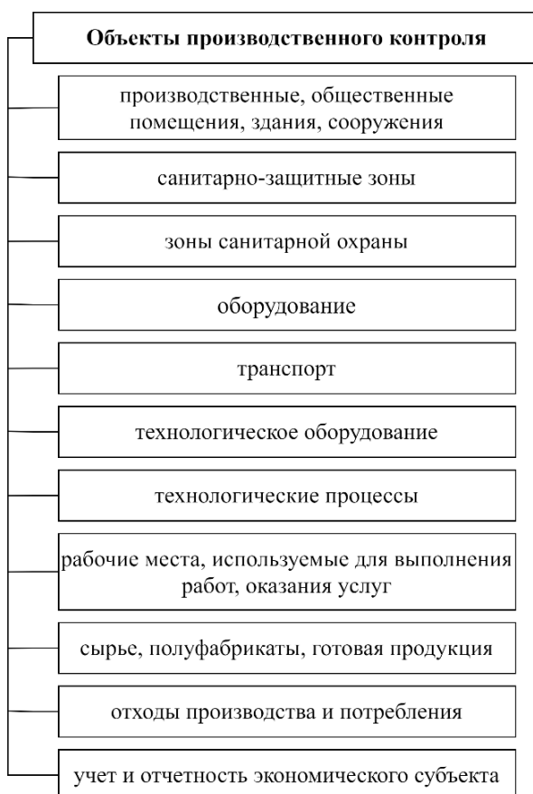
Рис. 5. Объекты производственного контроля

В соответствии с целями и задачами Программы (плана) производственного контроля объектами производственного контроля выступают: (рис. 5)