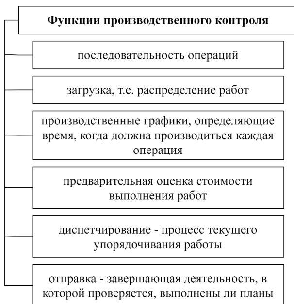
Рис. 4. Функции производственного контроля

список не органичен, каждая корпоративная организация может расширять перечень функций производственного контроля, исходя из возлагаемых на него задач, однако все они будут направлены на предупреждение неблагоприятных последствий осуществления деятельности корпоративной организации [2].