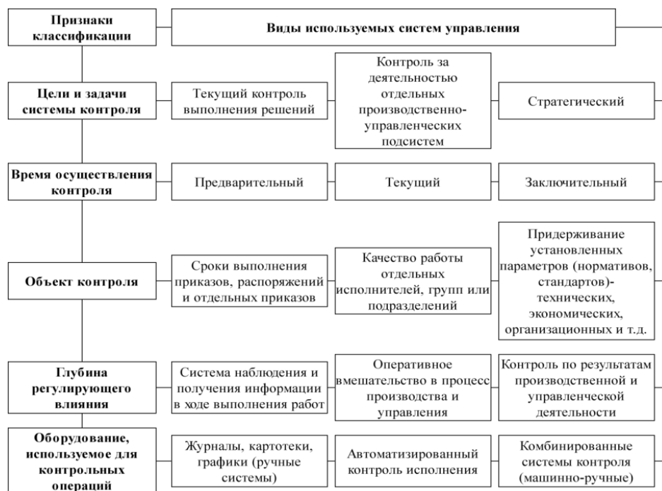
Рис. 1. Классификация действующих в организациях систем контроля выполнения планов, заданий

В корпоративных организациях используют различные системы контроля, отличающиеся по целям, задачам, объектам, методам и формам контроля, что представлено на рис. 1.