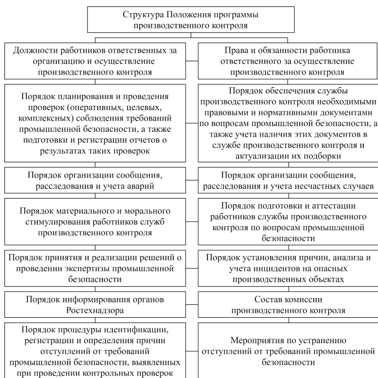
Рис. 6. Структура Положения программы производственного контроля

Предлагаемый набор разделов Положения программы производственного контроля представлен на рис. 6.