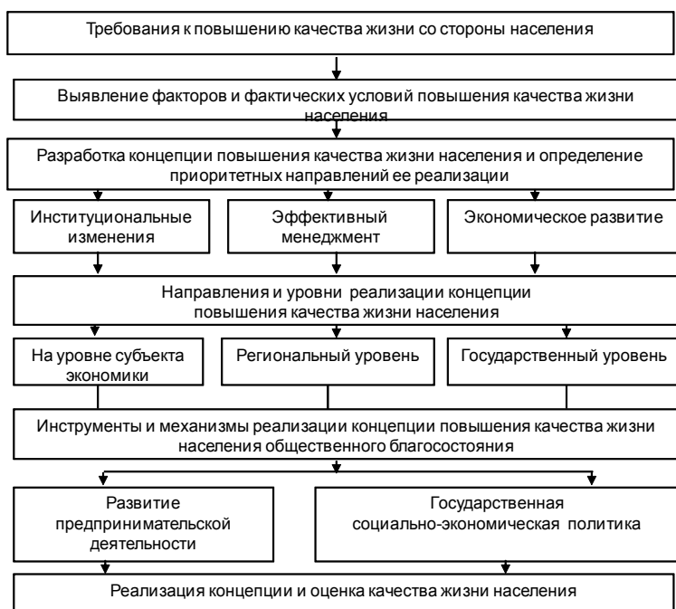
Рис. 1. Концепция повышения качества жизни населения

В качестве важнейших инструментов и механизмов следует рассматривать развитие предпринимательской деятельности и разработку социально-экономической политики, отвечающей современному состоянию экономики как на государственном, так и на региональном уровнях.