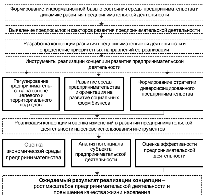
Рис. 3. Алгоритм формирования и направления реализации концепции развития предпринимательской деятельности региона

б) социальную эффективность – качественную оценку деятельности, выражающую соответствие цели предпринимательской деятельности потребностям и интересам населения. Социальный эффект сложно измерить количественными методами, но вместе с тем его можно оценить только по качественным преобразованиям, происходящим в социально-экономической системе: улучшение социально-психологической обстановки, сокращение времени обслуживания клиентов, повышение качества обслуживания и т.д.