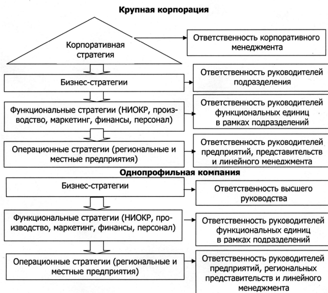
Рис. 1. Пирамида разработки стратегии в региональной корпорации

но идет разработка стратегии на следующих уровнях: на высшем уровне формируется корпоративная стратегия, на следующем уровне – создается стратегия бизнеса, на третьем уровне располагаются стратегии функциональных подразделений, на последнем уровне формируется операционная стратегия (см. рис. 1).