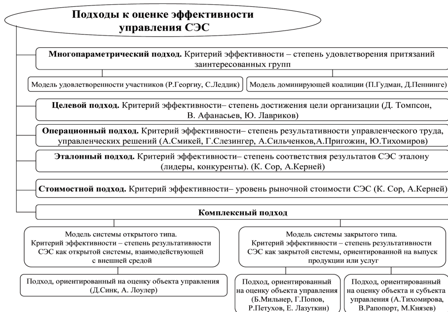
Рис. 1. Комплексный подход к оценке эффективности управления социально-экономическими системами

либо одной областью, без учета остальных показателей. Путем анализа и систематизации взаимосвязей функциональных областей социально-экономической системы, получены следующие интегральные показатели оценки эффективности ее управления: доля рынка, производительность, финансовое состояние, стоимость предприятия.