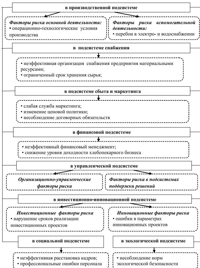
Рис. 2. Функциональная классификация внутренних рискообразующих факторов деятельности хлебопекарных предприятий

управленческой и экологической. Предлагаемый вариант классификации внутренних факторов риска представлен на рис. 2.