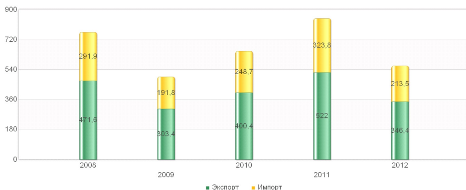
Рис. 1. Динамика внешней торговли в 2008 - 2012 годах по состоянию на 01.09.2012 года, млрд долл.

Поступления от внешнеэкономической деятельности (таможенные сборы, НДС, акцизы) в 2011 году занимают 41% доходной части федерального бюджета (рис. 2, табл. 1) [1].