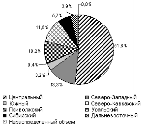
Рис. 3. Внешнеторговый оборот по федеральным округам Российской Федерации

производства), историческим ходом экономического развития и множеством других факторов. Наименьшее значение внешнеторгового оборота демонстрируют Северо-Кавказский и Южный федеральные округа. И это несмотря на то, что Южный федеральный округ занимает важное геостратегическое положение. Значительная протяженность сухопутных и морских внешних границ предопределяет логистическую внешнеторговую значимость и национальную специализацию ЮФО как транзитера внешнеторговых грузов для России и других государств.