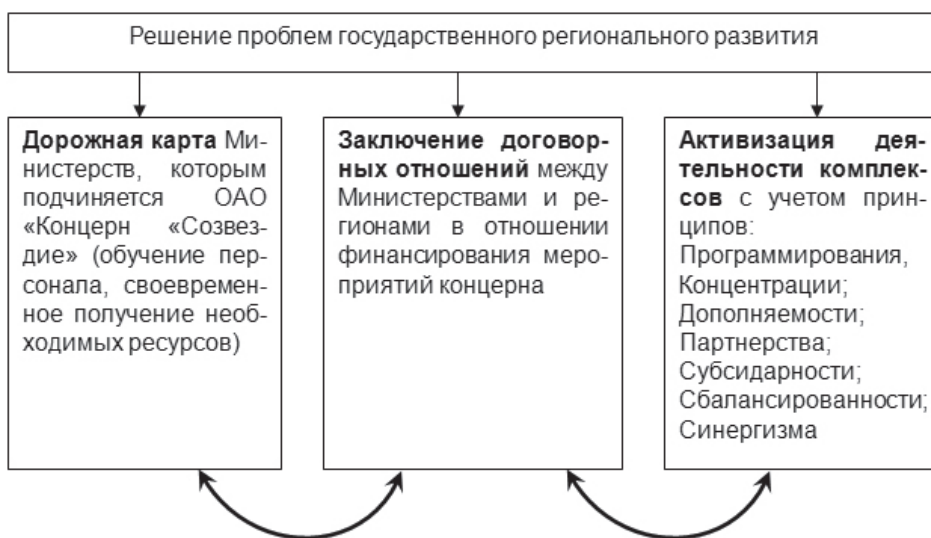
Рис. 2. Регулирование проблем государственного и регионального развития с учетом активизации деятельности комплексов

Урегулированию проблем регионального развития, взаимосвязанных с деятельностью промышленных комплексов, частично будет способствовать реализация следующих механизмов: дорожная карта Министерства промышленности и торговли, которому подчиняется концерн, заключение договорных отношений между министерствами (Министерство промышленности и торговли, Министерство Высшего образования) и регионами, а также программирование и планирование активной деятельности предприятий концерна, которые представлены на рис. 2.