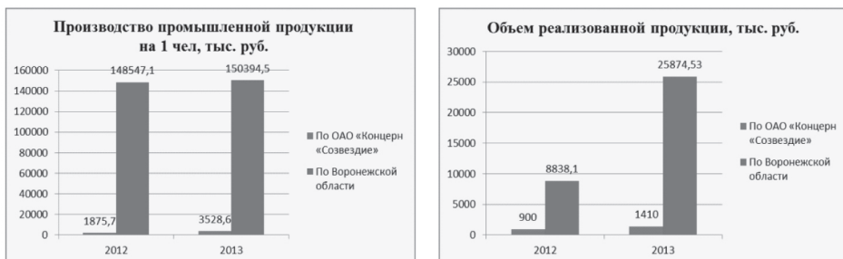
Рис. 3. Сравнительные показатели развития региона и ОАО «Концерн «Созвездие»

Оба подхода свидетельствуют о необходимости согласования приоритетов и совместных мероприятий центральных и региональных органов с участием промышленных комплексов (третий подход) в определении объемов и механизмов финансирования этих мероприятий, способствующих их развитию (рис. 3).