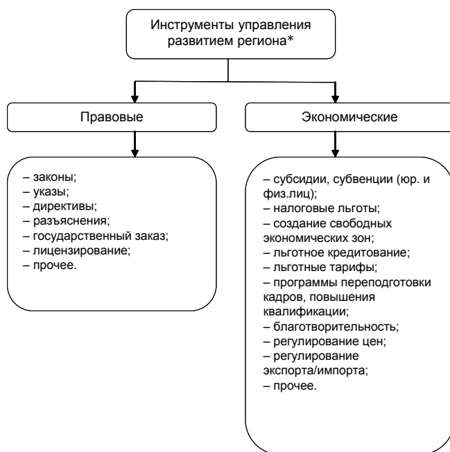
Рис. 2. Инструменты управления развитием региона

Отдельно стоит отметить двойственность влияния методов и инструментов развития на формирование сбалансированного развитого региона. На рис. 1 эта особенность отражена в возможности субъектов регионального развития с помощью методов (инструментов) оказывать воздействие на факторы, определяющие условия регионального развития, так и непосредственно на состояние региона. В качестве примера можно привести Закон №103-ОЗ «О социальной поддержке отдельных категорий граждан в Воронежской области» (с последующими изменениями). Он, с одной стороны, относится к категории нормативно-правовых факторов, которые формируют политические и социальные условия для сбалансированного регионального развития, а с другой стороны, оказывает непосредственное влияние на демографическую политику, выраженную в стимулировании рождаемости в регионе.