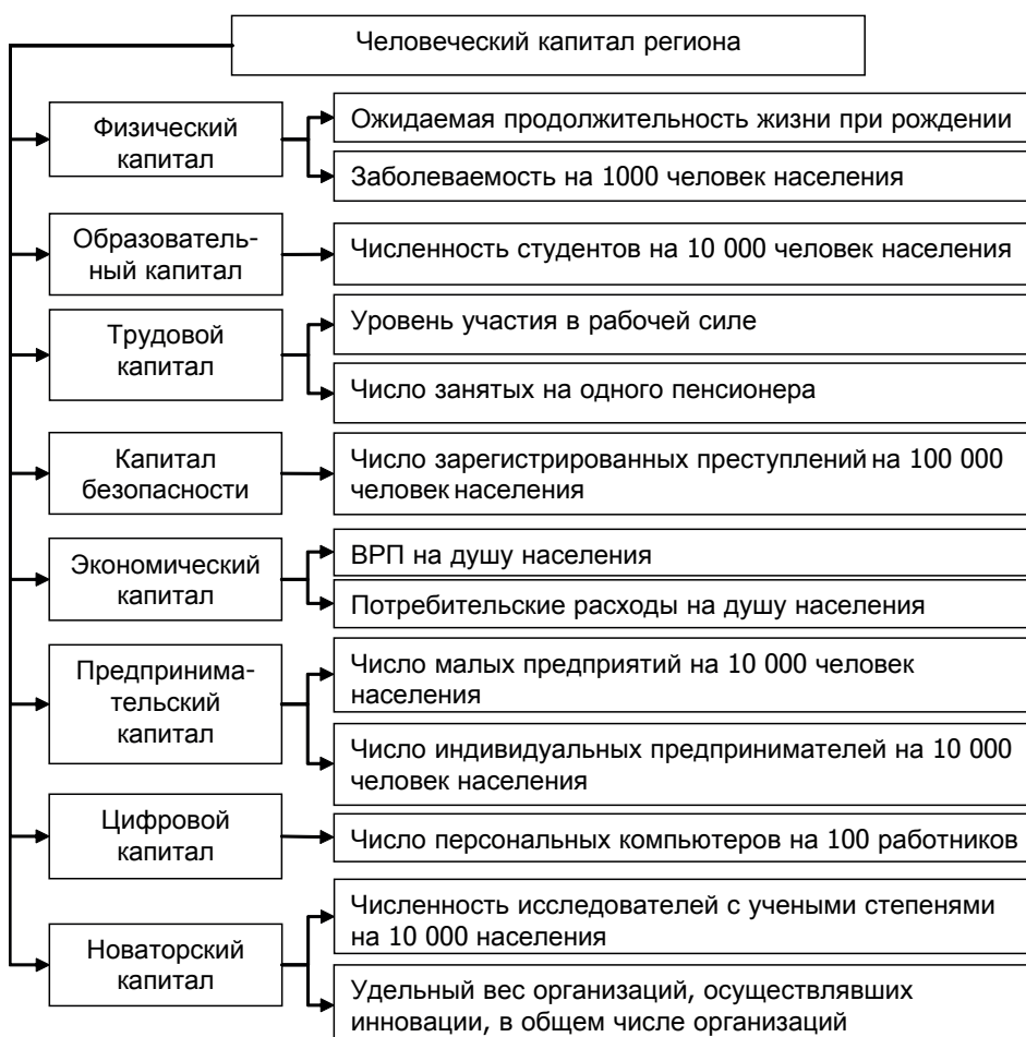
Рис. 1. Структура и показатели развития ЧКР (авт.)

При разработке системы показателей оценки ЧКР (рис. 1) мы исходили из наличия открытых систематически собираемых данных по регионам РФ и опирались в данном аспекте на статистический сборник Федеральной службы государственной статистики «Регионы России. Социально-экономические показатели» ( https://www.gks.ru/folder/210 ).