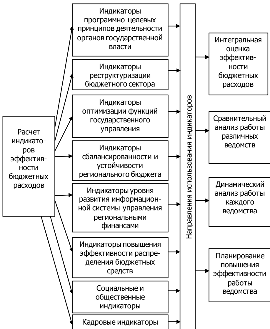
Рис. 4. Система показателей оценки эффективности бюджетных расходов Брянской области

Внедрение мониторинга эффективности бюджетных расходов в регионе даст возможность соизмерять затраты и результаты, выбирать наиболее эффективные пути расходования бюджетных средств, своевременно оценивать степень достижения запланированных результатов и их качество.