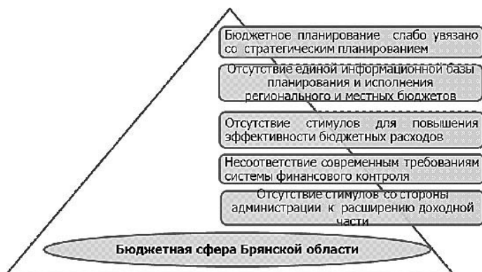
Рис. 3. Концептуальные проблемы бюджетной сферы Брянской области

Для модернизации системы управления в бюджетном секторе необходимо устранить ряд проблем, имеющих место в регионе. Концептуальные проблемы региона изображены на рис. 3.