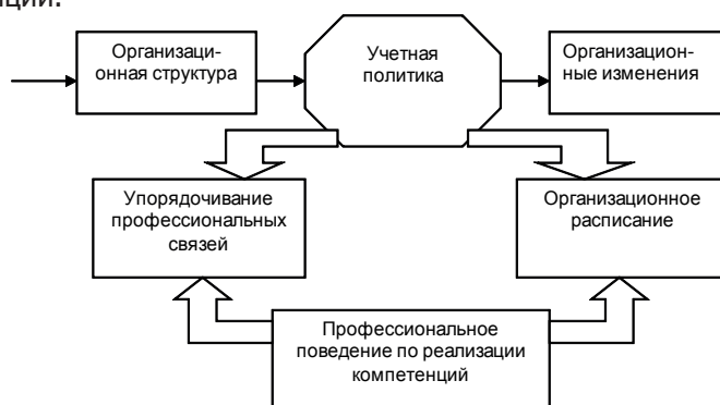
Рис. 3. Организационный контур построения бухгалтерских процедур

ность строго заданного расписания по отчетным датам выполнения бухгалтерских процедур и построения последовательной цепи действий по обеспечению эффективной реализации персоналом своих профессиональных компетенций.