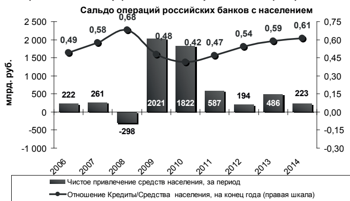
Рис. 1. Сальдо операций российских коммерческих банков с населением [рассчитано по данным Банка России]

Наиболее динамично развивающимися направлениями кредитования были ритейл (розничное кредитование) и кредитование с помощью пластиковых карт, что связано с ограниченностью ресурсов российских банков. Для предоставления кредитов предприятиям реального сектора и финансовым организациям на достаточно длительные сроки требуются дефицитные «длинные деньги» в значительном размере, получить которые невозможно без привлечения новых долгосрочных источников финансирования. Для розничного кредитования (кроме ипотеки) этого не требуется.