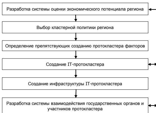
Рис. 2. Алгоритм выявления IT-протокластера в регионе

1. Разработка системы оценки экономического потенциала региона. Высокий инновационный потенциал региона играет основополагающую роль в процессе кластеризации.