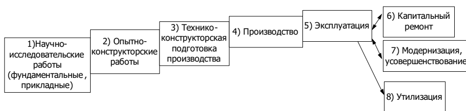
Рис. 2. Жизненный цикл наукоемкой и высокотехнологичной продукции

В зависимости от участия предприятия в этапах жизненного цикла наукоемкой и высокотехнологичной продукции можно отнести предприятие к наукоемкому или высокотехнологичному. Так, на первых трех этапах жизненного цикла наукоемкой и высокотехнологичной продукции важную и решающую роль играют наукоемкие предприятия (организации) – научно-исследовательские институты, вузы, конструкторские бюро, научно-технологические центры. Модернизация и усовершенствование высокотехнологичной и наукоемкой продукции также являются деятельностью наукоемких предприятий. Производство высокотехнологичной и наукоемкой продукции осуществляется на высокотехнологичных предприятиях, оснащенных высокотехнологичным оборудованием, используя труд высококвалифицированных инженерно-технических работников.