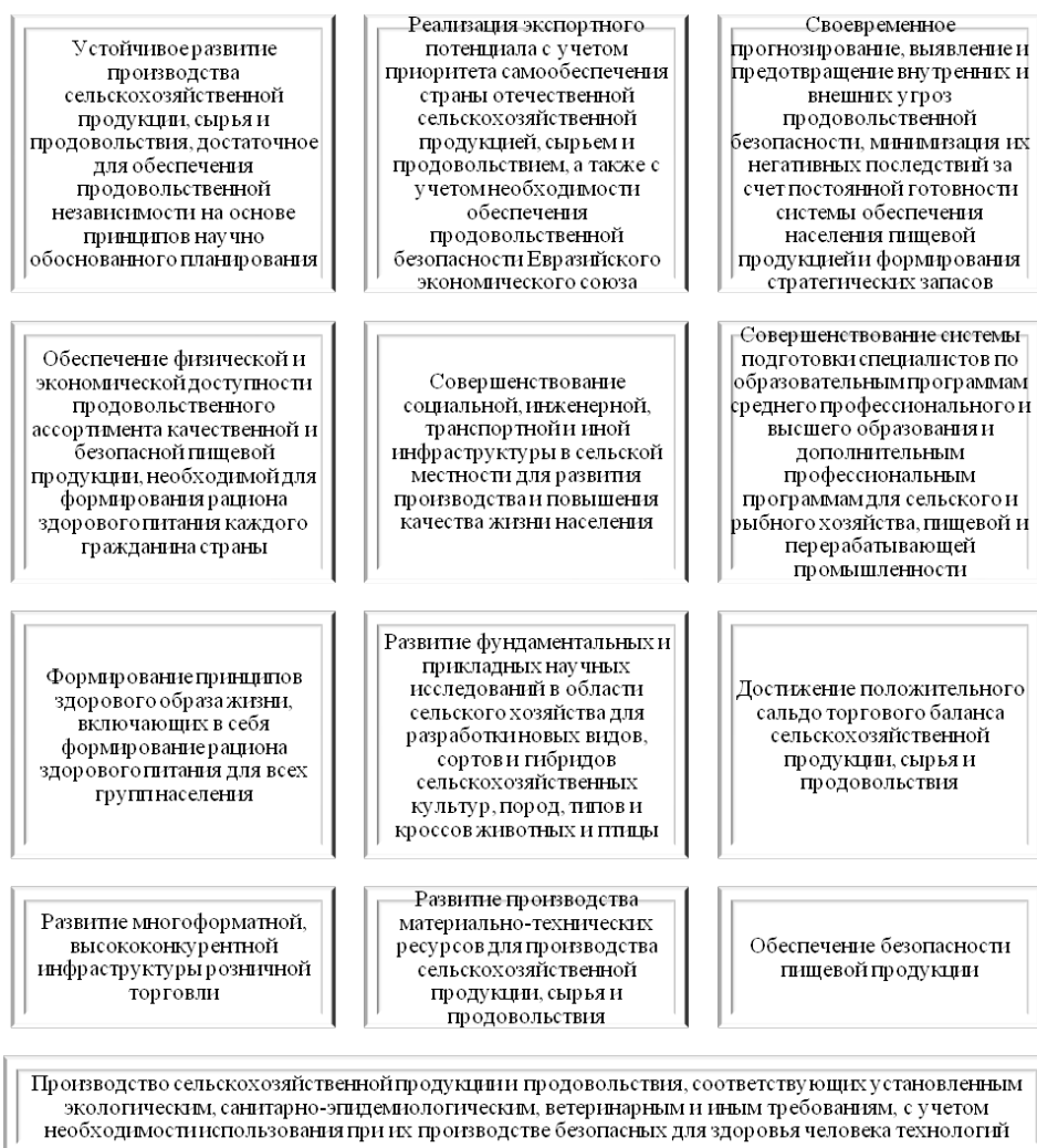
Рис. 2. Основные задачи обеспечения продовольственной безопасности РФ

Подчеркнем, что, согласно положению продовольственной Доктрины РФ, ключевой целью является обеспечение населения качественными продуктами, которые были бы доступны как экономически, так и территориально. Все это должно способствовать повышению доли здоровых рационов питания, а также уровня и качества жизни граждан. Основные задачи обеспечения продовольственной безопасности России, независимо от влияния условий эндо- и экзоуровней, проиллюстрированы на рисунке 2 10 .