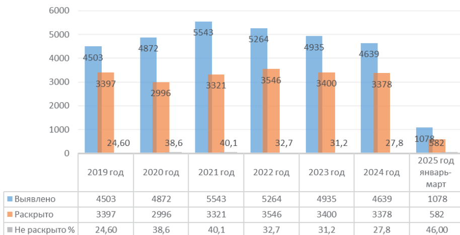
Рис. 1. Динамика и уровень выявленных и раскрытых налоговых преступлений, которые направлены в суд, а также доля нераскрытых преступлений в РФ в период с 2019 по 2025 год (по информации, предоставленной МВД РФ, источник https://мвд.рф )

По данным всестороннего анализа налоговой преступности в РФ, проведенного МВД РФ, общее число зарегистрированных налоговых преступлений составило 4,6 тысячи, что можно увидеть на рисунке 1. За этот период материальный ущерб, причинённый налоговыми преступлениями, представляет собой серьезную проблему и его размер оценивается примерно 43,5 миллиарда рублей. В период с 2019 по 2021 год наблюдался неуклонный подъем числа налоговых правонарушений. За указанный трехлетний промежуток времени правоохранительными органами было зарегистрировано свыше 14,8 тысячи преступлений, связанных с уклонением от уплаты налогов. Ущерб, нанесенный государственному бюджету в результате этих действий, оценивается более чем в 72,2 миллиарда рублей. Начиная с 2021 г. наблюдается устойчивое снижение количества преступлений, совершаемых налогоплательщиками. При этом процент раскрываемости данных преступлений демонстрирует стабильность в период с 2019 по 2024 гг. около 3,3 тыс. ед., не претерпевая существенных изменений. Раскрытие всех зарегистрированных налоговых преступлений представляет собой сложную задачу, и значительная их часть остается нераскрытой, около 30% от общего числа. Так, компаративная оценка динамики числа налоговых преступлений, установленных государственными органами России в период с 2021 по 2024 гг., выявила тенденцию к их уменьшению на 12,3%.