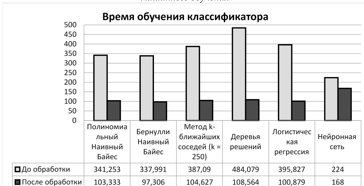
Рис. 3. Сравнение времени обучение классификатора документов при различных методах машинного обучения