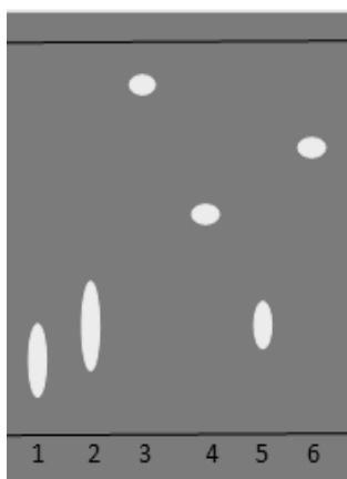
Рис. 1. Вид хроматограммы стандартных образцов органических кислот в системе №4: 1 – щавелевая кислота; 2 – лимонная кислота; 3 - янтарная кислота; 4 – аскорбиновая кислота; 5 – винная кислота; 6 – яблочная кислота. Объем пробы 5 мкл